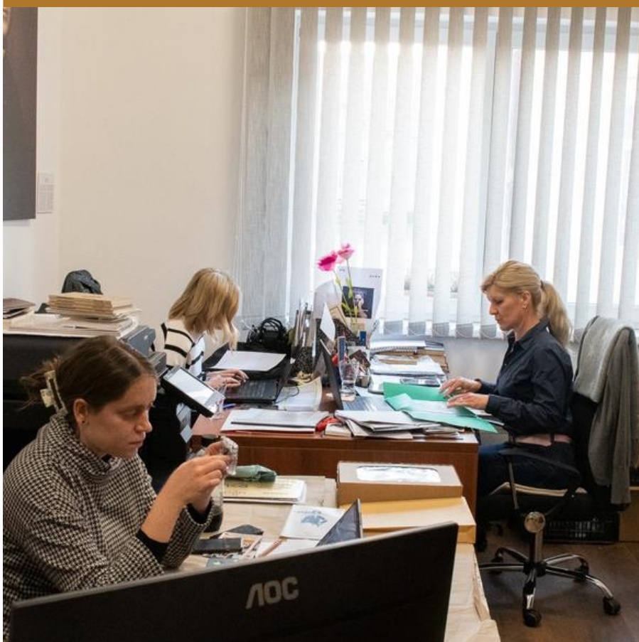
Kiss István iroda