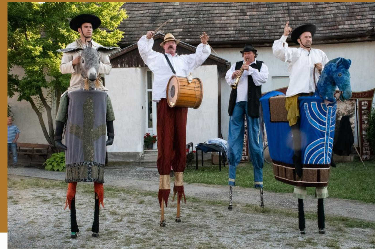
Szent László Napi Hagyományőrző Búcsú

Az együttműködés fontos része a csapatunk működésének. Tudj hatékonyan kommunikálni másokkal, legyen az szóban vagy írásban. A csapatban való munka során a kommunikációs készségeid előnyt jelenthetnek.