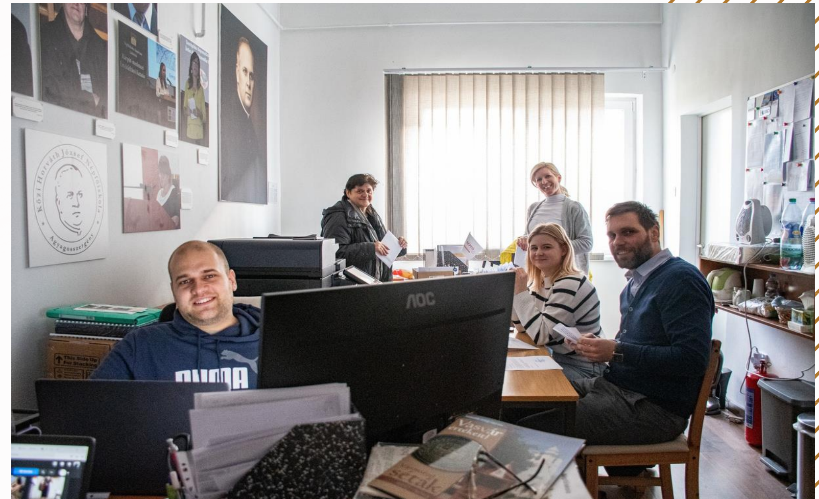
Irodai munkavégzés a Népfőiskolán

Az agyagosszergényi Közi Horváth József Népfőiskola gyakornoki programot hirdet, amely lehetőséget kínál a közösség szervezés szakon tanuló (kulturális közösség szervezés, humánfejlesztés szakirány) hallgatóknak kötelező szakmai gyakorlatuk elvégzésére.