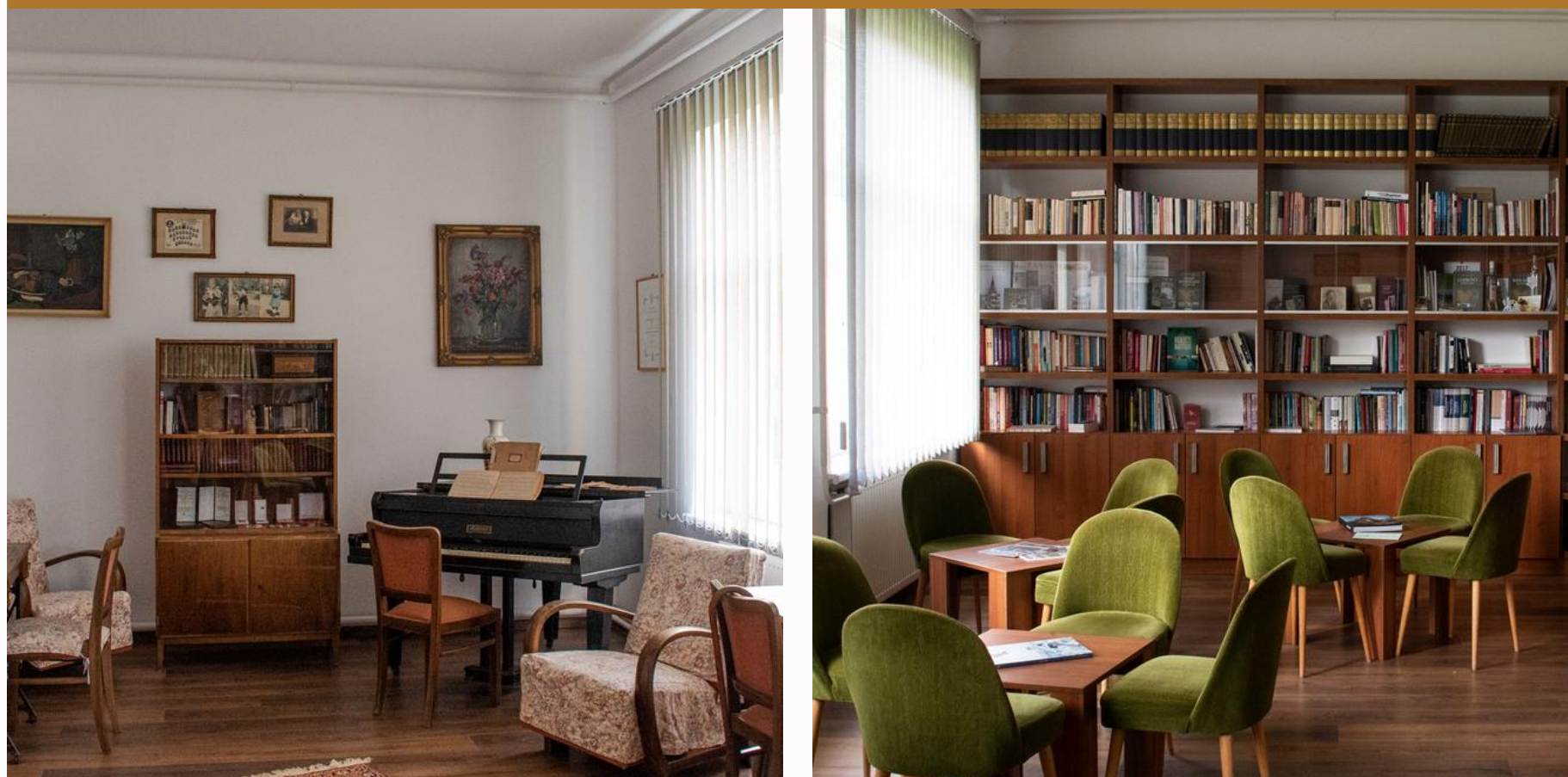
Koloszár házaspár terem és könyvtár